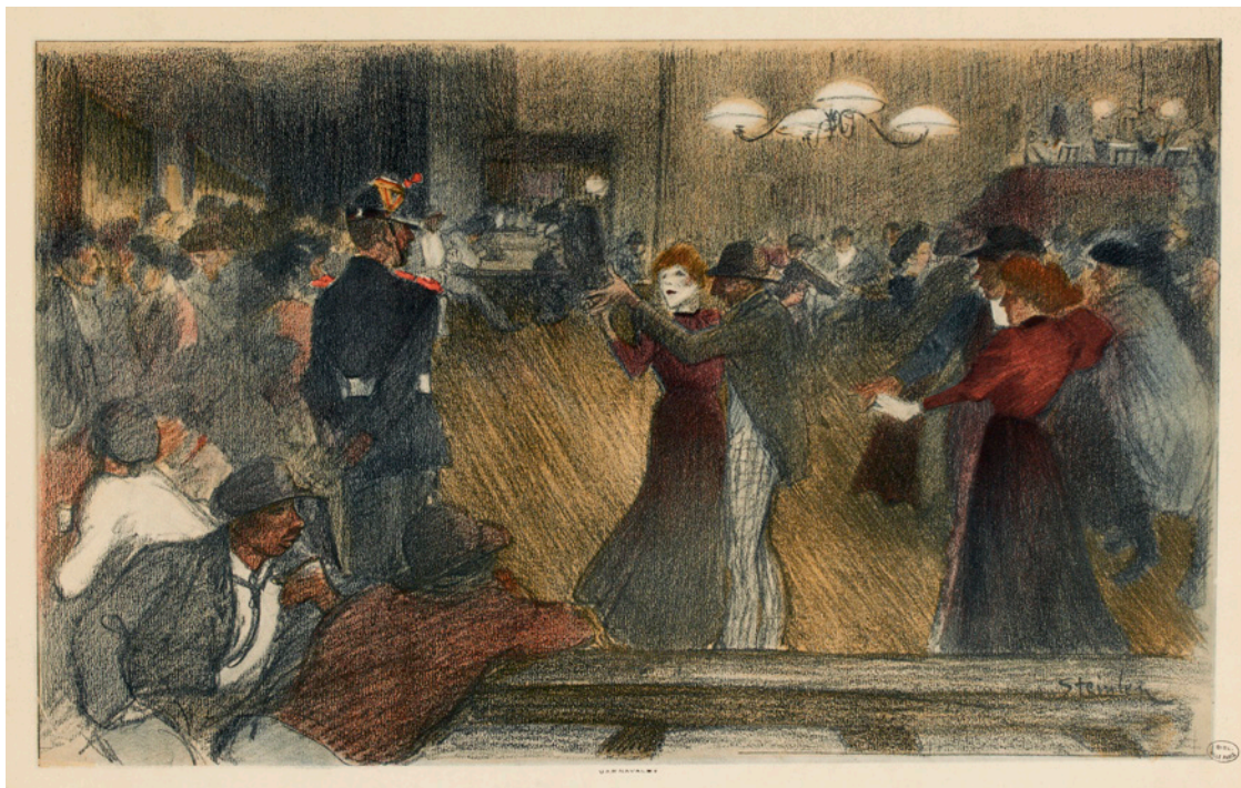
Théophile Alexandre Steinlen, Bal de Barrière , 1898, © Bibliothèque nationale de France

D'origine suisse, Théophile Steilen (1859-1923) rejoint Paris et Montmartre en 1881. Il s'insère rapidement dans le groupe des artistes emblématiques du quartier, en fréquentant avec eux les cabarets et les cafés-restaurants. Peintre, graveur, sculpteur ou encore affichiste, Théophile Steinlen s'intéresse aux marges : prostituées, mendiants, déshérités et voyous des faubourgs de Paris ou de ses alentours sont de ses centres d'intérêt.