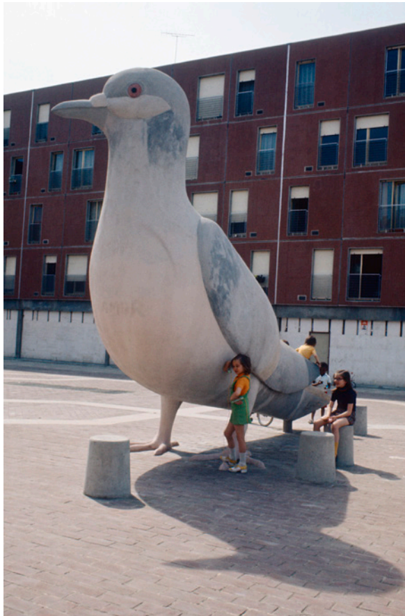
Jean-François Noël, Pigeon , place de la treille, La Grande Borne, Grigny, 1973. Collection Jean-François Noël - auteur-photographe.

les habitants de ces constructions désormais décriées et régulièrement soumises à l'action des explosifs souhaitent conserver des traces de leurs vies en ces lieux. Dans ce temps de la mémoire des grands ensembles* qui est notre présent, il est nécessaire de restituer leur place complexe et paradoxale dans l'histoire de la France de la seconde moitié du XX e siècle. Différentes initiatives tentent, voire permettent d'énoncer de façon plus nuancée et polyphonique l'histoire de ces lieux de vie. En témoignent le travail de l'Association pour un Musée du logement populaire (AMuLop) ou des créations telles que le film Gargarine (2020) qui par le biais de la fiction dit l'attachement des habitants à la cité rouge d'Ivry.