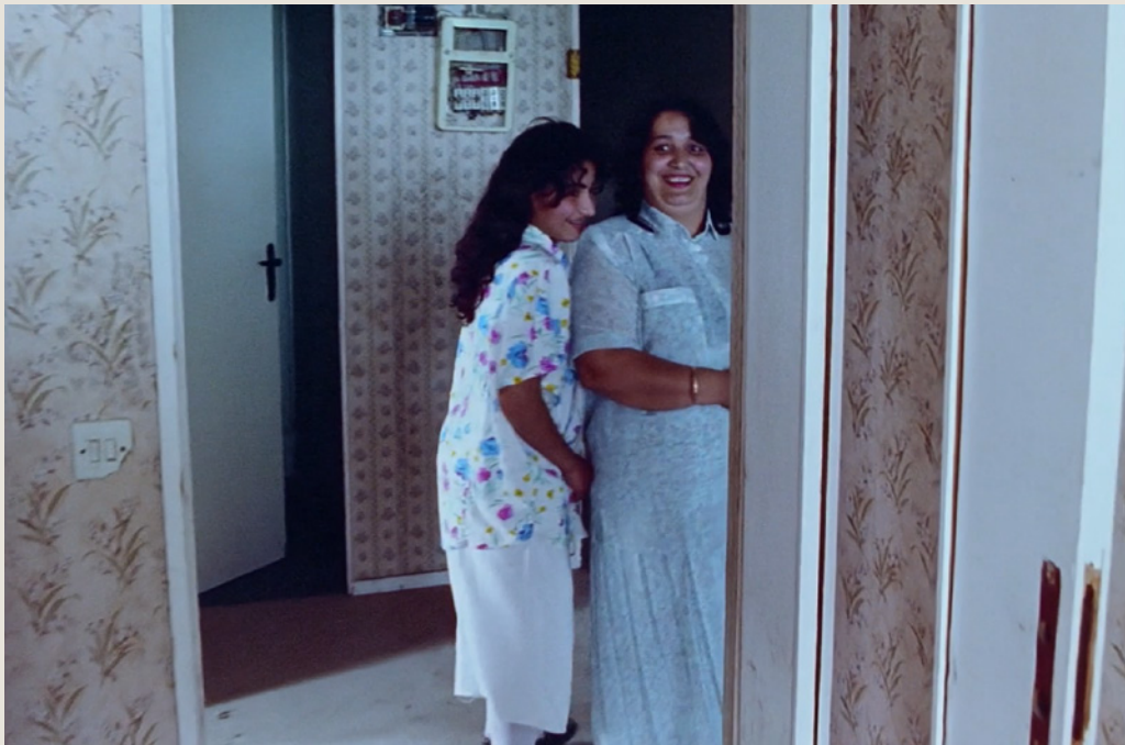
Dominique Cabrera, Chronique d'une banlieue ordinaire , 1992. Production : Iskra, en coproduction avec Canal+ et l'INA

Pour Chronique d'une banlieue ordinaire , la cinéaste, née en 1957, qui a vécu dans ce type de banlieue populaire quand sa famille a été rapatriée d'Algérie, se préserve des clichés sur le « problème des banlieues » qui saturent le débat public, pour se concentrer sur des paroles intimes, anonymes et ordinaires. Aussi capte-t-elle les souvenirs des anciens locataires sans éluder les difficultés de leur vie dans les tours, ni pour autant fermer la porte à l'empathie. De cet entrelac de paroles naît une histoire audiovisuelle tissée de mémoires diverses. Une histoire qui, malgré les étages, s'écrit par le bas et bouscule les représentations et discours hâtifs sur ces lieux et leurs habitants, si souvent décriés, mais trop peu écoutés.