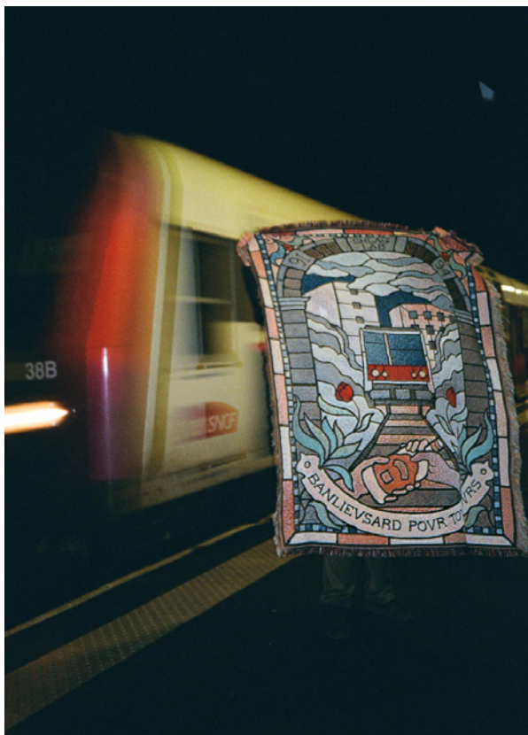
Collectif Schlag Lab, BANLIEVSARD POVR TOIORS , 2024. Tapisserie murale tissée, Musée national de l'histoire de l'immigration

Shlag Lab est un atelier d'impression en sérigraphie, animé par un collectif d'artistes, dessinateurs, tatoueurs et graphistes basé à Vitry-sur-Seine dans le Val-de-Marne. Leurs créations, marquées du sceau de l'indépendance et du DIT (pour Do It Together , pendant collaboratif du Do It Yourself ) s'impriment sur une multitude de supports : textiles (tapisserie, t-shirts et maillots de football, empiècements), verre et céramique ou vaisselle, papier pour les fanzines, magnets ou encore affiches.