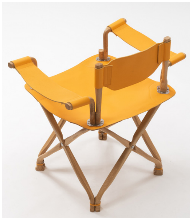
Hall Haus, Fauteuil Curry Mango, 2021

Un siècle plus tard, la chaise pliable Décathlon Quechua, modèle à succès de mobilier nomade et bon marché, lointaine descendante de la B3, a conquis le cœur des adeptes du camping, du farniente au soleil, en vacances ou au pied d'une tour de grand ensemble d'une banlieue populaire. Les designers du studio Hall Haus, originaires pour une partie de Limoges et pour une autre de la banlieue parisienne, s'emparent de ce modèle qui leur est familier et l'hybrident avec la chaise de Marcel Breuer qu'ils connaissent en professionnels. Ainsi, ils donnent naissance au Fauteuil Curry Mango présentée dans l'exposition Banlieues chéries , pont temporel et culturel entre deux mondes. Une manière un peu canaille de tordre le cou aux clichés.