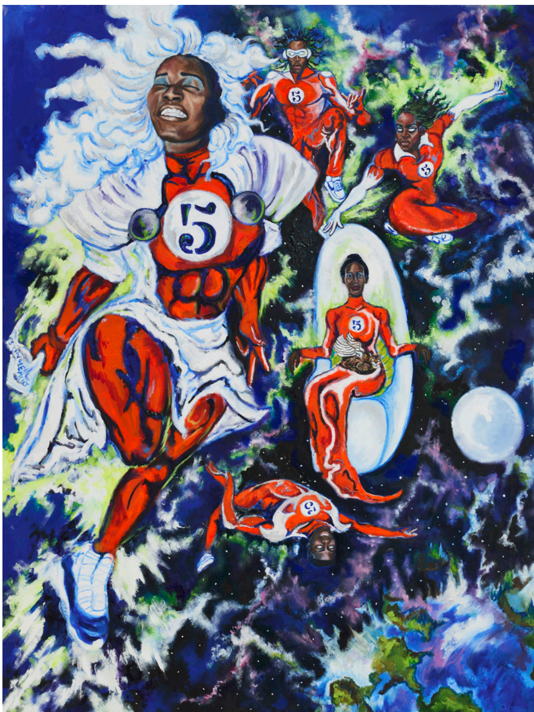
Ibrahim Meité Sikely, The Five Marvelous Neighbors from the 5th Floor , 2023

ou animées, design sont autant de domaines où se réinventent les banlieues, leurs paysages, leurs horizons, par le biais de créatrices et de créateurs. Les dangers de l'esthétisation ou de la « domestication » de pratiques artistiques souvent très libres comme le graffiti, ne sont pas absents de ce bouillonnement créatif.