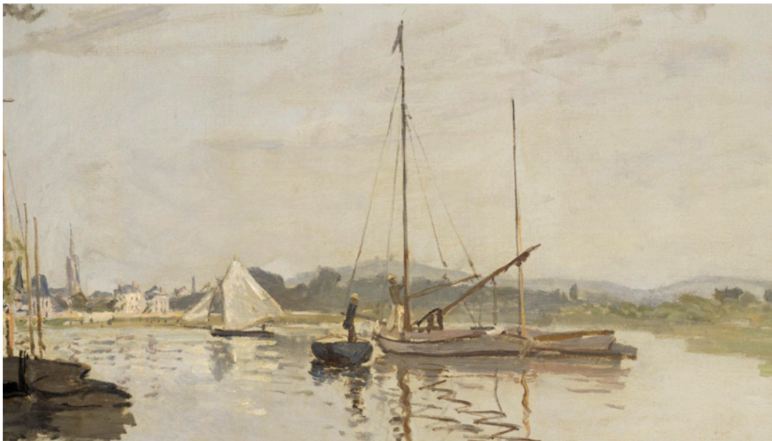
Claude Monet, Argenteuil , 1872. Paris, musée d'Orsay

Les peintres ont observé et restitué des images de ces banlieues avant qu'elles ne s'urbanisent et s'industrialisent rapidement au début du XX e siècle. Installés avec leurs chevalets dans ces territoires, ils en peignent les paysages à l'aide de leurs tubes facilement transportables. Corot, Monet, Seurat,