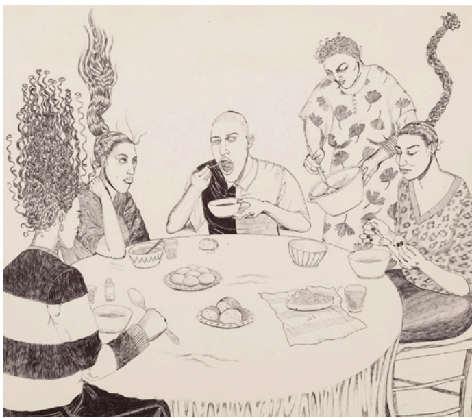
Neïla Czermak Icti, Chorba Glacée , 2019. Acquisition 2024. Centre national des arts plastiques © Neïla Czermak Icti / Cnap.

Neïla Czermak Icti est née à Bondy en 1996 et est diplômée de l'Ecole des Beaux-Arts de Marseille. Son univers artistique brasse des thématiques familiales et intimes : ses proches sont les modèles qui l'inspirent comme dans Chorba Glacée , évocation d'un repas traditionnel nord-africain chez la grand-mère de l'artiste. La chorba est, en effet, une soupe qui se consomme couramment, mais plus encore lors du mois de Ramadan, au début du ffour , moment quotidien de la rupture du