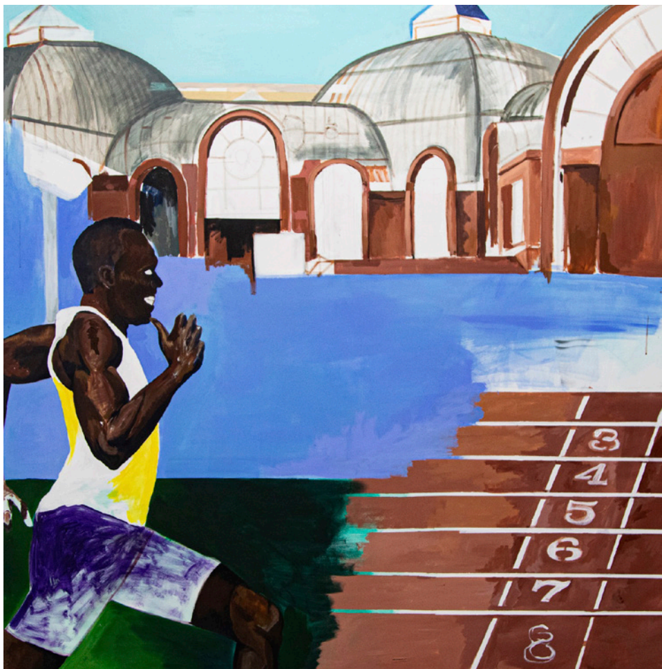
Lassana Sarre, Courir pour être curieux , 2022. © Lassana Sarre — Galerie Polaris Paris