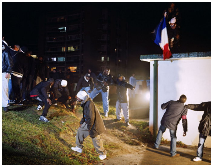
Mohamed Bourouissa, La République , série « Périphérique », 2006. Musée national de l'histoire de l'immigration

Mohamed Bourouissa est né à Blida en 1978. Son œuvre photographique se plaît à brouiller les frontières du réel et de la mise en scène, du reportage documentaire et de la création artistique, afin de questionner les angles morts, les marges et les zones d'exclusion du pays qui est devenu le sien, la France. Le cycle « Périphérique » a débuté en 2005 après les violences urbaines qui se sont déroulées dans nombre de banlieues populaires, en réaction à la mort de Zyed Benna et Bouna Traoré.