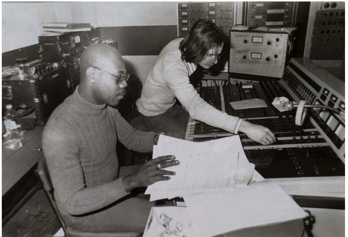
Manu Dibango en studio

Dans un contexte européen de repli national et de volonté de fermeture des frontières, l'exposition, qui ouvrira quelques semaines avant le Brexit , prévu le 29 mars 2019, se place au cœur de la plus brûlante actualité .