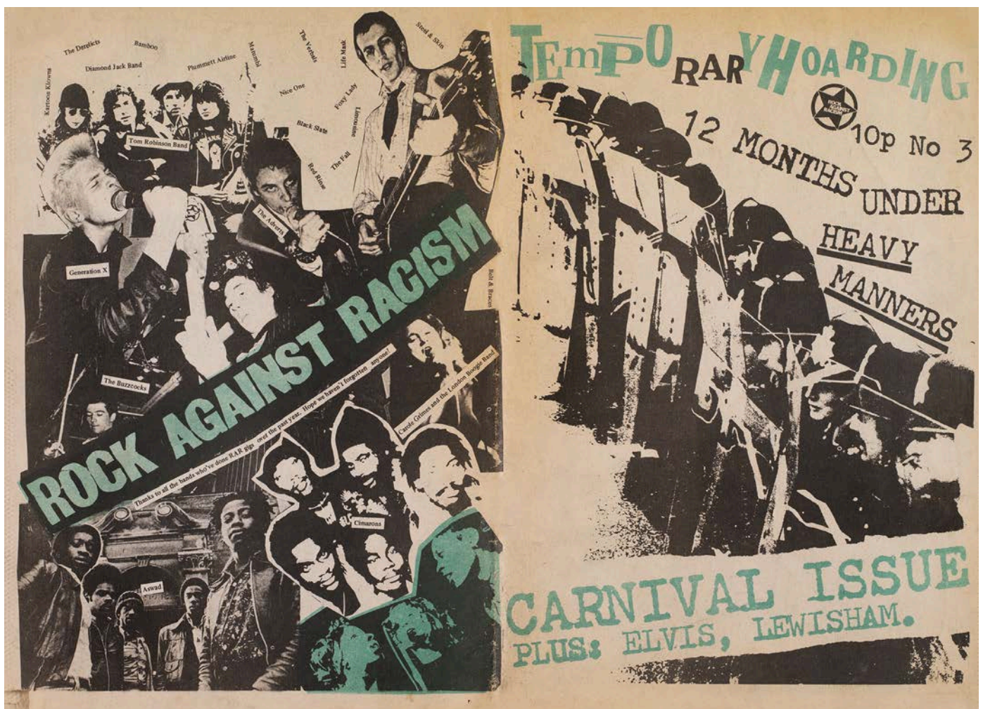
Affiche Rock against Racism

1973 : premier choc pétrolier. L'Europe occidentale entre dans un contexte de récession économique . De part et d'autre de la Manche, les politiques migratoires des gouvernements français et britannique se durcissent , les conditions de vie des populations immigrées dans les cités HLM et les banlieues, ou dans les quartiers en déshérence du centre londonien, demeurent, bien souvent, ignorées. La montée de l'extrême-droite et l' affirmation d'un discours politique raciste constituent le terreau de nouvelles mobilisations . Les scènes rock parisienne et londonienne se mobilisent autour de l'antiracisme. Le concert, les grandes marches vont être les moyens privilégiés d'expression d'une protestation et d'une visibilité revendicatrice, mais également d'un nouveau lieu de luttes communes, d'échanges et de rencontres.