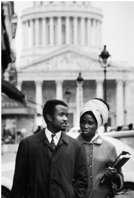
Reportage pour le centre d'éducation civique des Africaines à Paris, Etudiant et sa femme devant le Panthéon, 1966, Janine Niépce

Paris et Londres accueillent également d'importants flux migratoires liés à la demande croissante de main-d'œuvre de travailleurs immigrés, venue en majeure partie de leurs anciennes colonies. Les deux villes peuvent être alors qualifiées de « villes hypercoloniales » où les cultures, notamment musicales, des premières générations d'immigration vont s'exprimer dans les cafés parisiens de Barbès, les clubs de Soho ou de Camden Town, les salles de concerts des quartiers populaires ou de banlieue, les squats du centre de Londres ou de la périphérie de Paris, les foyers de jeunes travailleurs immigrés, les MJC et les community centres , les studios d'enregistrement, avant les grandes marches (la Marche pour l'égalité et contre le racisme, en France) et des manifestations antiracistes (le carnaval de Notting Hill) de la fin des années 1970 et du début des années 1980.