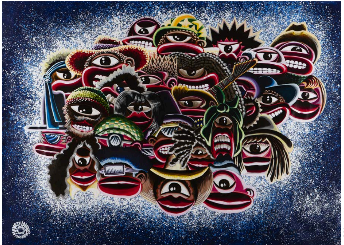
Hervé Di Rosa, Londres

Le tournant des années 1980 est un moment privilégié de mise en connexion des artistes entre Paris et Londres . C'est le cas de Rachid Taha du groupe Carte de Séjour , Mick Jones du groupe The Clash . À Londres sont produits et diffusés des artistes comme Fela Kuti , Salif Keita , Youssou N'Dour , Alpha Blondy ... Les mobilisations politiques antiracistes et les grands concerts participent de ces jonctions musicales. Les styles musicaux produits, diffusés et écoutés à Paris, notamment avec la multiplication des radios libres , et à Londres contribuent à redéfinir les frontières musicales et à donner aux deux villes leur visage de « villes globales » .